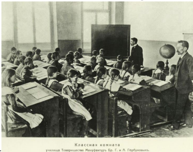
Классная комната училища Товарищества Мануфактур Бр. Г. и А. Горбуновых. Село Серeda Нерехтского уезда, Костромской губернии. В 2-х классном училище при ф-ке Т-ва Мануфактур Бр. Г. и А. Горбуновых. 1913 год.

В конце 19 века начальное народное образование в России было признано первостепенной государственной важностью. В связи с ростом числа школ в сельской местности и повышением уровня грамотности крестьян совместными усилиями государства, земства и всех наличных общественных сил началось открытие библиотек.