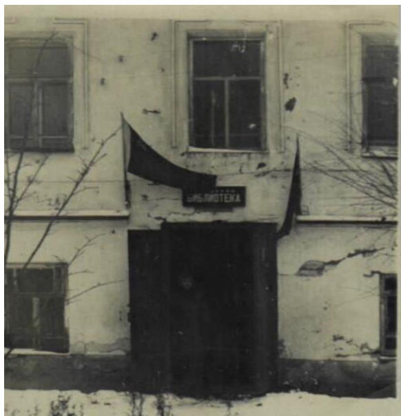
Середская библиотека в 1970-е – нач. 2000-х гг.