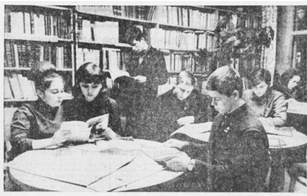
В читальном зале Середской библиотеки. 1968 год.