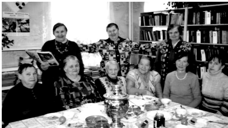
Заседание клуба «За чашкой чая»

проходят интересно и весело, поэтому члены клуба посещают библиотеку с завидным постоянством, чем радуют библиотекаря.