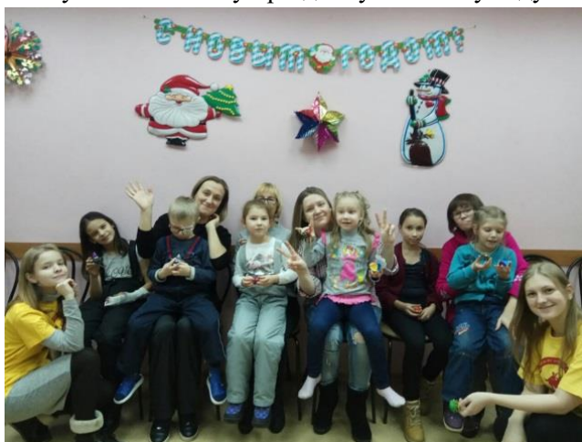
Участники мастер-класса «В мастерской у Зимушки-зимы»

Перед Новым годом в библиотеке начала работать мастерская по изготовлению ёлочных игрушек и подарков к самому долгожданному и волшебному празднику – Новому году.