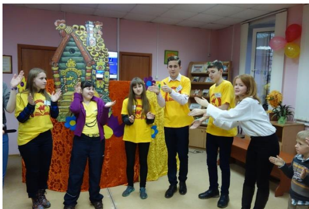
Театрализованное представление «Фея Жара против»

А 22 декабря дети и родители ЯРООСР «Радуга детства» пришли на новогоднее театрализованное представление «Фея Жара против».