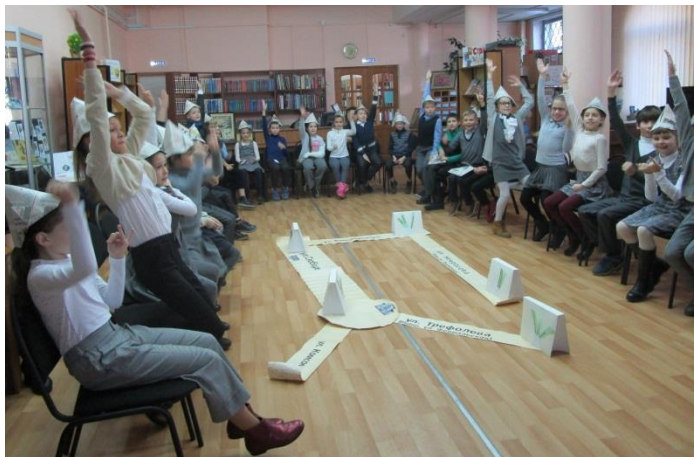
Участники игры «В исторический полет отправляем «Книголет»

экипажей получилось свое путешествие, так как истории выбирались разные. В начале путешествия выбирались «художники», которые придумывали свое изображение «Книголета», в течение всей игры велся бортжурнал, в который заносились самые важные сведения, услышанные во время путешествия.