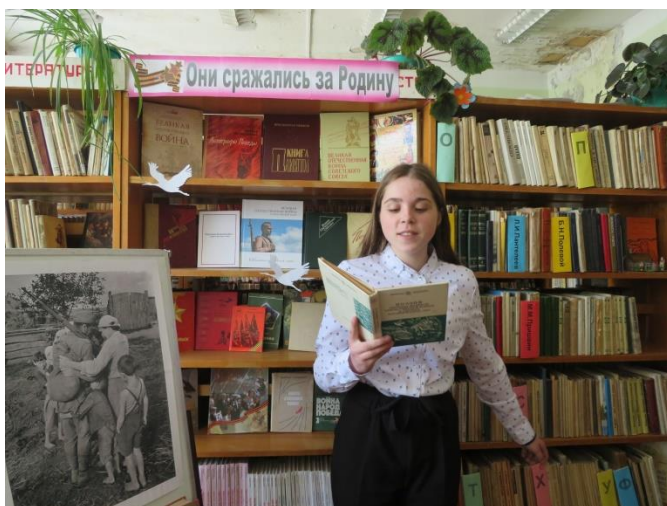
Конкурс выразительного чтения «Возьми себе в пример героя» из цикла мероприятий «Великая поступь Победы». Ребята выбирали стихи по желанию и читали их проникновенно и искренне (Белосельская библиотека, Пошехонский район).