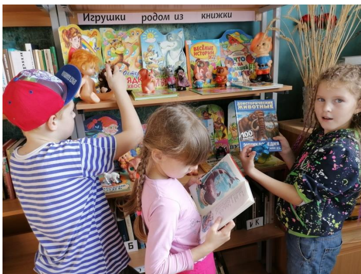
Экспозиция из игрушек – литературных персонажей переросла в мини-музей в библиотеке (проект «Игрушки родом из книжки», Марьинская сельская библиотека, Даниловский район).