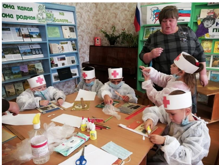
Библиолаборатория «Лечебница для книг» – это и игра, и труд, и новые знания (МУК «Некоузская ЦБ им. А. В. Сухова-Кобылина», Октябрьская библиотека).