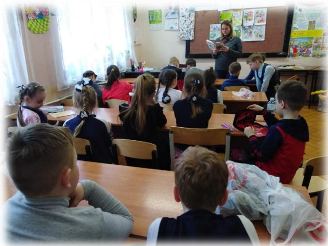
«Энциклопедия для любознательных» - эрудицион для учащихся в школе № 75

Члены оргкомитета оценивали задания второго этапа по следующим критериям: 1) профессионализм; 2) содержательность; 3) оригинальность; 4) владение современными техническими средствами; 5) соблюдение регламента выступления; 6) грамотная и убедительная устная речь.