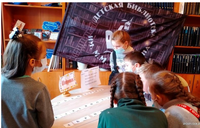
Литературный квест «Путь к успеху», или Экзамены в школе детективов (Детская библиотека им. М. М. Пришвина, г. Переславль-Залесский).