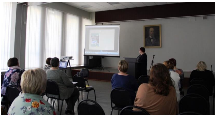
Защита творческих проектов в Ярославской областной библиотеке

Второй этап конкурса, согласно Положению, проходил в очном формате. В этот раз для презентации творческой работы конкурсантам были предложены различные наглядные формы, такие как экскурсия, буктрейлер, открытое мероприятие и др. В рамках второго этапа состоялись два открытых мероприятия на базе библиотек.