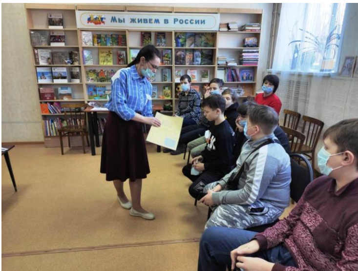
Мероприятие в филиале № 12 МУК ЦСДБ г. Ярославля

А в детском отделе Гаврилов-Ямской МЦРБ нам представили социально-культурный проект «Твоя Точка Чтения» (сроки реализации 2019-2020 г.), направленный на решение проблемы внешкольной занятости детей и подростков, привлечению и активизации их чтения и творческой деятельности, созданию привлекательного имиджа библиотеки, увеличению количества пользователей детского отдела.