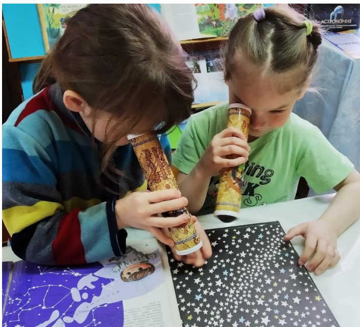
Интерактив с игровыми элементами «Космические приключения Незнайки» (Никологорская библиотека МУК «Первомайская МЦБС»).