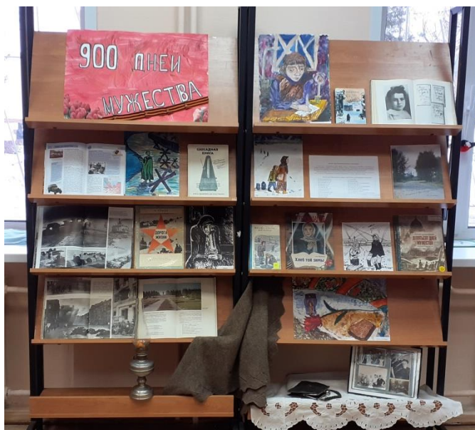
Выставка «900 дней мужества»: с помощью книг, предметов и иллюстративного материала читателям передали атмосферу блокадных дней (Детская библиотека МУК «Первомайская МЦБС», п. Пречистое).